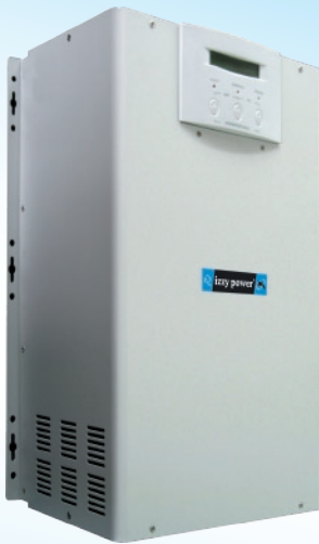
斷路器 遙控器接孔